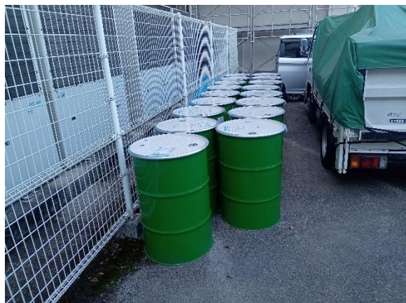
エバーコートZero-1 ドラム缶荷姿